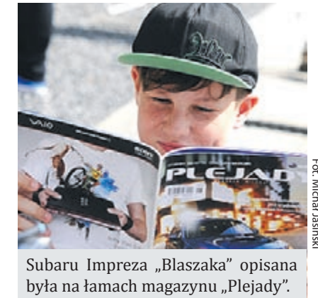
Subaru Impreza „Błaszaka” opisana była na łamach magazynu „Plejady”.