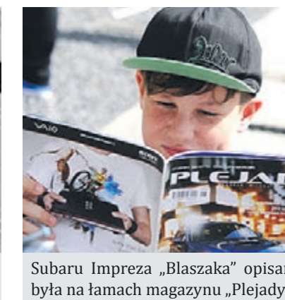
Subaru Impreza „Błaszaka” opisana była na łamach magazynu „Plejady”.